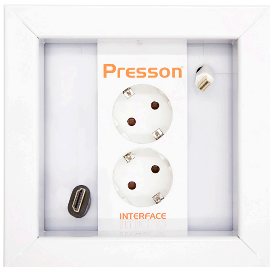
Pöytään asennettuna Interface Micro S-2 Lid frame metallikehyksellä.